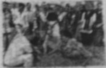
टीडी के तत्वेन व लोक जन सेवाओं में पौधारोपण करने हुए।