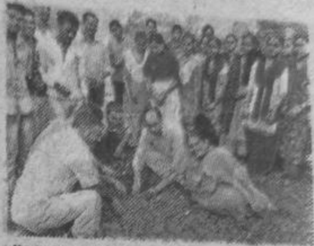
डोंडी के कॉलेज व गोद ग्राम खैरवाही में पौधारोपण करते हुए।